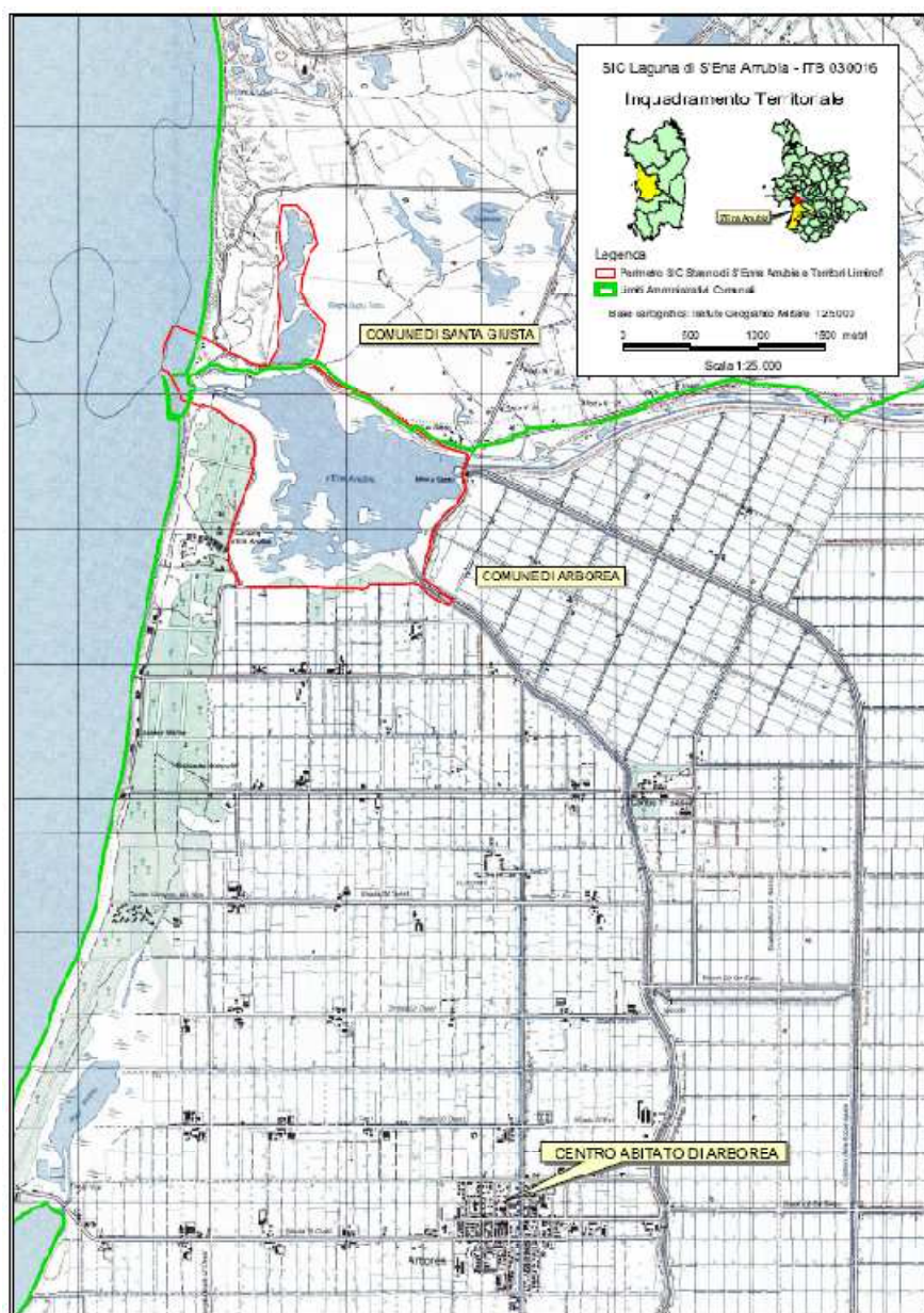
Figura 1 – Inquadramento territoriale del SIC S’Ena Arrubia e territori limitrofi

Il S.I.C. “Stagno di S’Ena Arrubia e territori limitrofi” – ITB030016 si trova nella fascia costiera meridionale del Golfo di Oristano, nella provincia di Oristano.